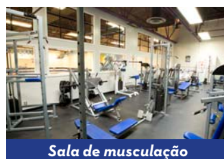
Sala de musculação