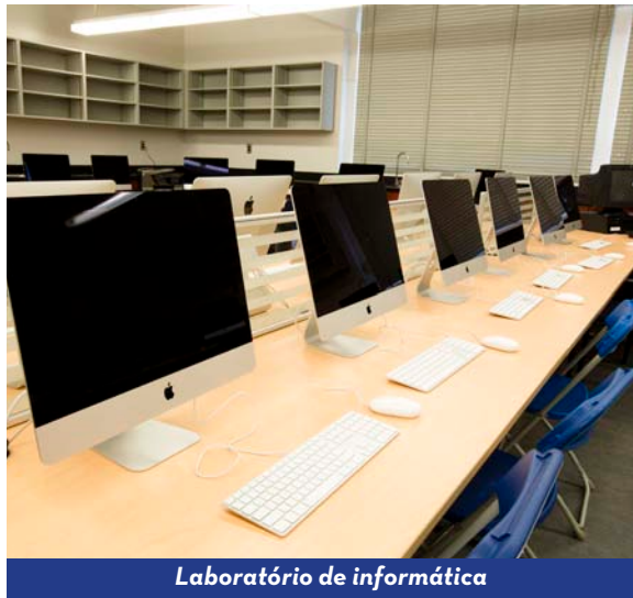
Laboratório de informática