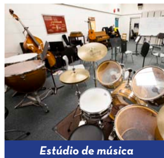
Estúdio de música