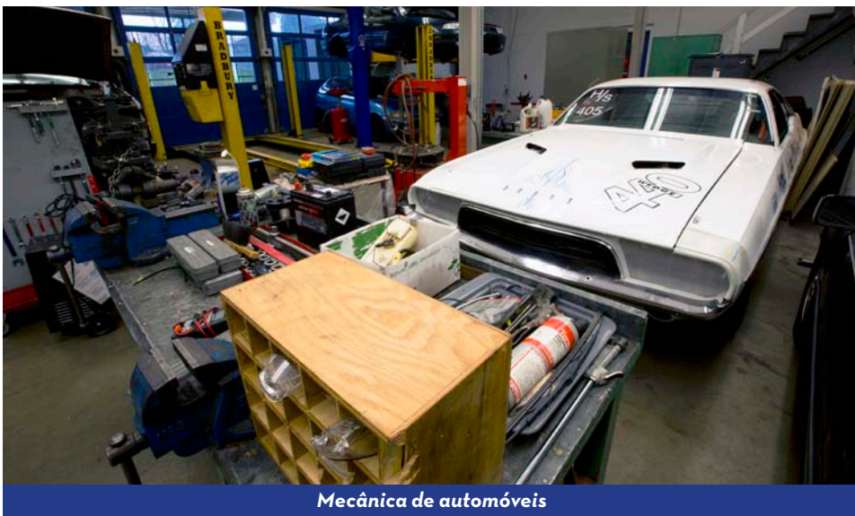
Mecânica de automóveis