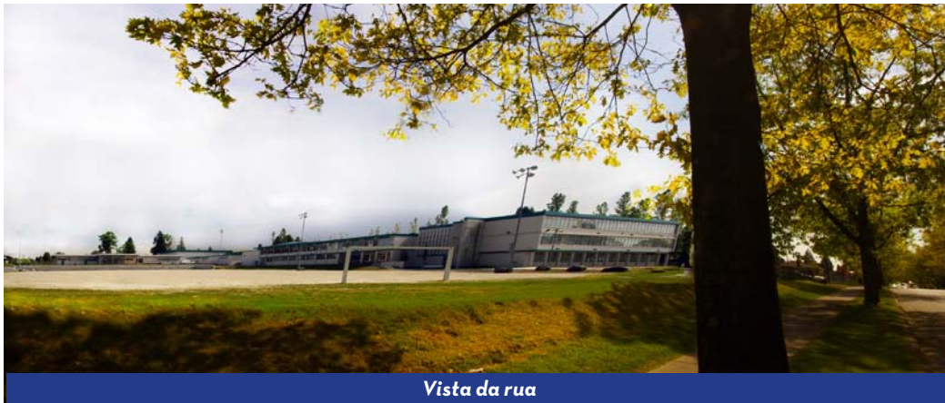
Vista da rua

DATAS INICIAIS Setembro e vagas limitadas em Fevereiro POPULAÇÃO DE ESTUDANTES 650; 6% internacionais