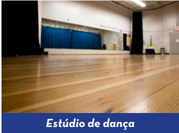
Estúdio de dança