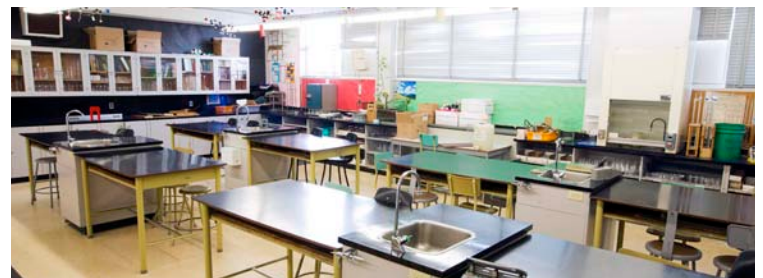
Laboratórios de ciências