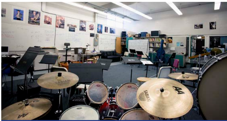
Estúdio de música