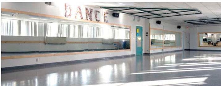
Estúdio de dança