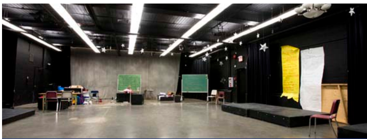
Estúdio de artes cênicas