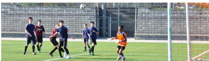
Campo de futebol