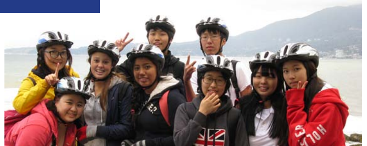
Passeio de bicicleta