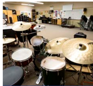
Estúdio de música