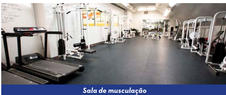
Sala de musculação