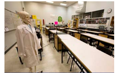
Sala de ciências