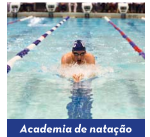
Academia de natação