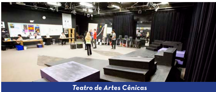
Teatro de Artes Cênicas