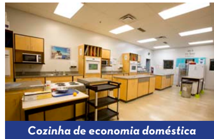
Cozinha de economia doméstica