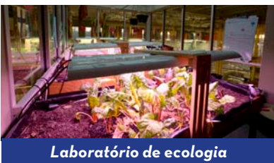
Laboratório de ecologia