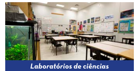
Laboratórios de ciências