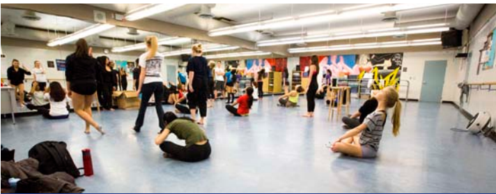
Estúdio de dança