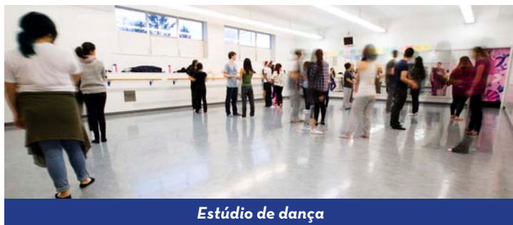
Estúdio de dança