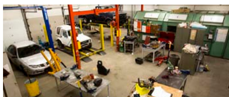
Mecânica de automóveis