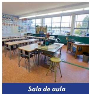
Sala de aula