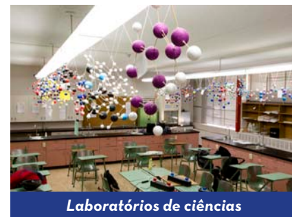
Laboratórios de ciências