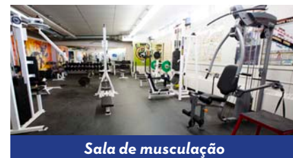
Sala de musculação