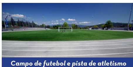
Campo de futebol e pista de atletismo