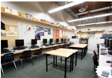
Laboratório de computadores Windows