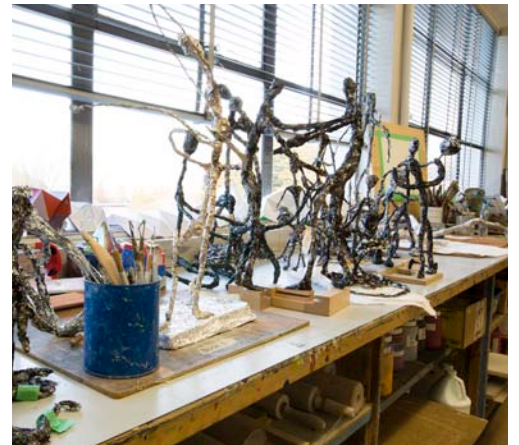
Estúdio de arte