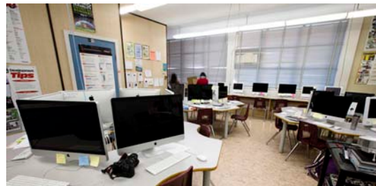
Laboratórios de computadores Machintosh