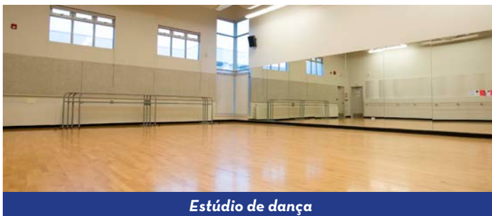
Estúdio de dança