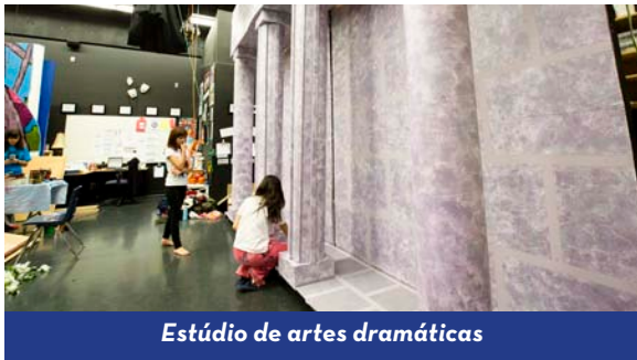
Estúdio de artes dramáticas