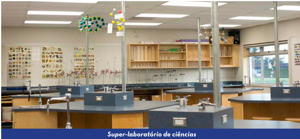
Super-laboratório de ciências