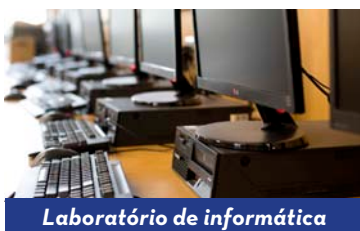
Laboratório de informática