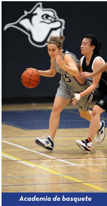
Academia de basquete