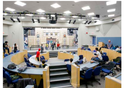
Centro de comunicação